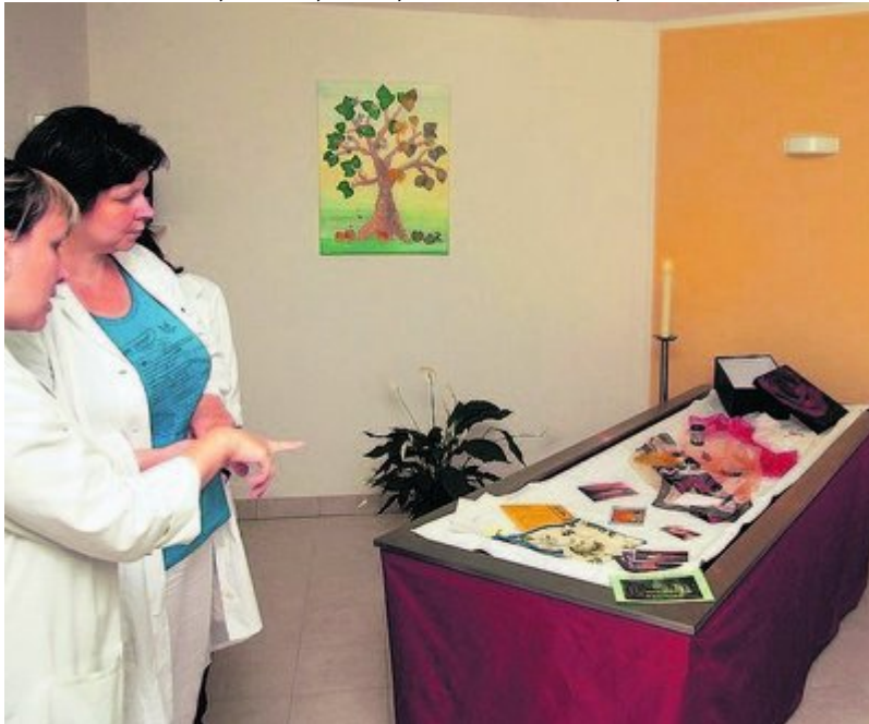
Blick in den Abschiedsraum in der Lungenklinik Ballenstedt.

VON SIGRID DILLGE, 04.09.09, 18:25h, aktualisiert 04.09.09, 20:09h